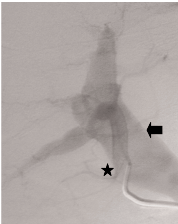
Fig. 1. Arteriografía selectiva de arteria hepática (asterisco) con relleno precoz de una vena porta intrahepática muy dilatada por la sobrepresión (flecha).