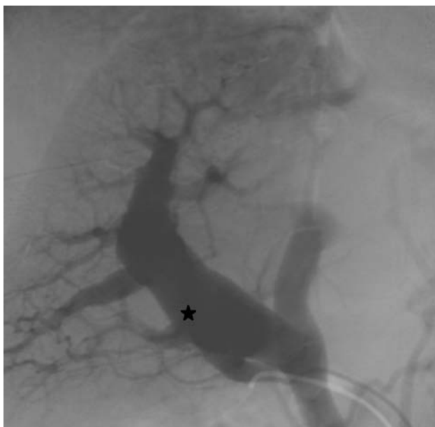
Fig. 2. Portografía rellena a través de la fístula arterioportal (asterisco) con importante dilatación de la rama derecha.

fágicas de grado III, que se trataron endoscópicamente con bandas, y descompensación ascítica. En marzo de 2003 se le efectuó una nueva biopsia hepática que objetivó leve lesión inflamatoria inespecífica de espacio porta y lobulillo. Dos meses después comenzó con un cuadro diarreico de 7 a 9 deposiciones líquidas al día e intolerancia a la alimentación oral, con náuseas y vómitos ocasionales, importante pérdida de